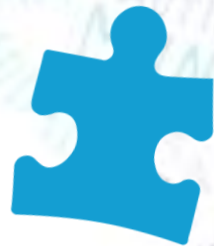
Una pieza de puzle azul