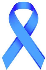
Un lazo azul

Si hacer un molinillo te resulta muy complicado (o simplemente no te apetece) puedes colgar cualquier otra cosa). Algunas ideas son: